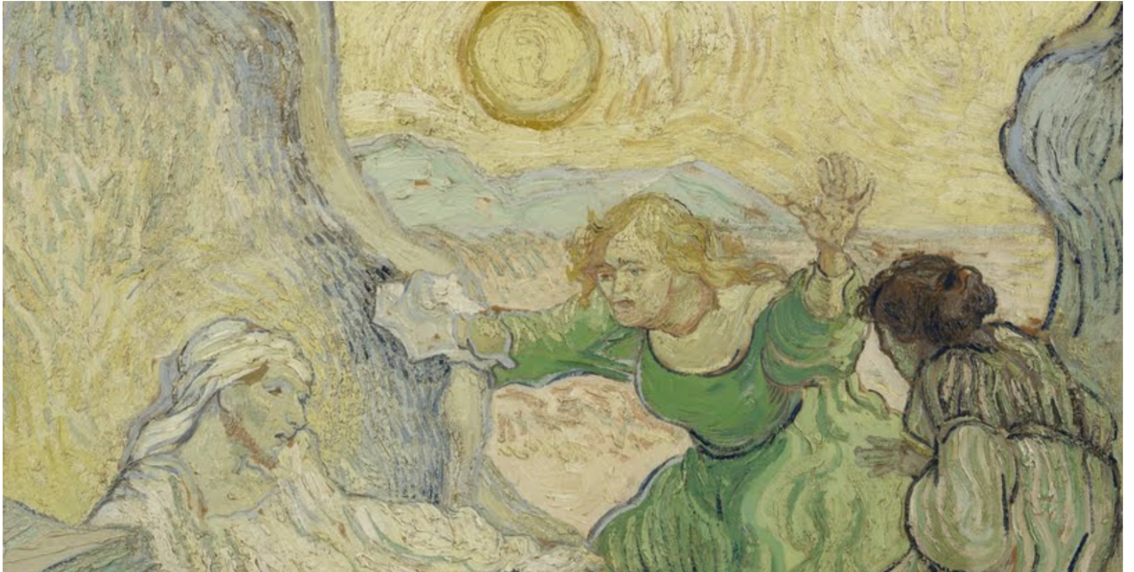
De opstanding van Lazarus door Vincent van Gogh