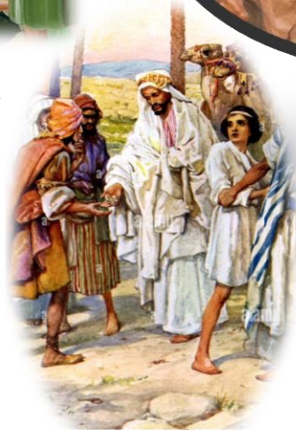
Verkocht als slaaf