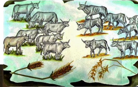
Zeven vette jaren zeven magere jaren