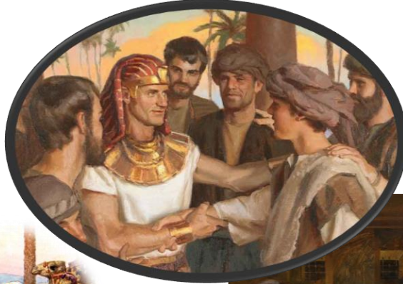
Van slaaf naar beheerder