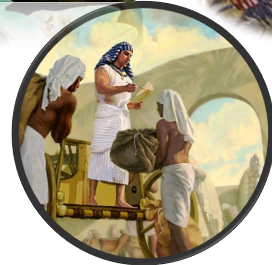
Gouverneur van Egypte