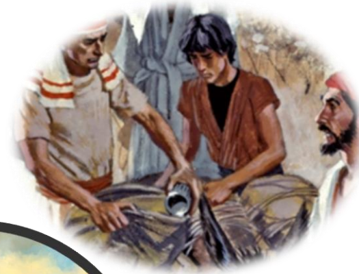
De zilveren beker